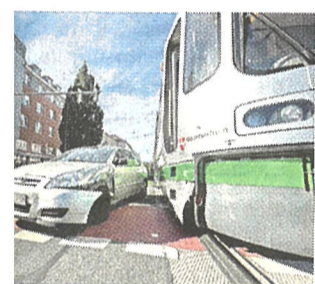
Toyota und die Stadtbahn kollidieren auf der Bielskistraße.

Bereits am Abend zuvor stürzte um 22.30 Uhr ein Auto den ungesicherten Betriebsablauf. Ein 71-jähriger Ortsunkundiger Fahrer geriet auf der Bielskistraße/Ecke Pasteurstraße (Groß-Buchholz/Bothfeld) über die Schienen der Stadtbahn. Die Angaben blieben sowohl der Carrera als auch Gleisbett unbeschadet. Nach kurzer Zeit war die Blockade beseitigt.